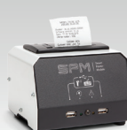
SPM: Printermodul 026919