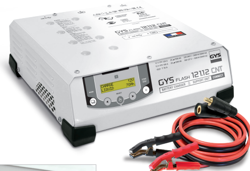
Leveres med kabler (5 m - 25 mm 2 )