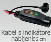
Kabel s indikátorem nabíjení 56 cm