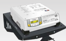
Nástěnná police 055513