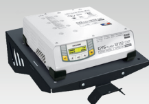
Sada připevnění na zdi 055513