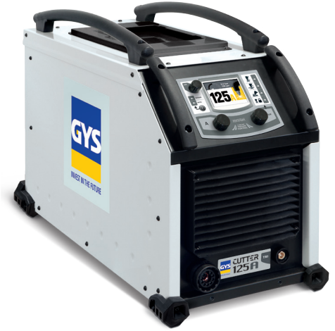
配有接地夹 (16 mm 2 电线配备，长度为4m)