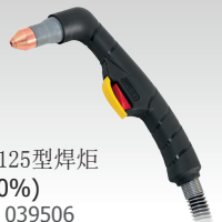
手动MT-125型焊炬 130A (60%) 6m - ref. 039506 12m - ref. 039513