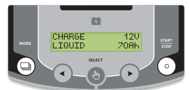
灵敏的操作界面 22种显示语言