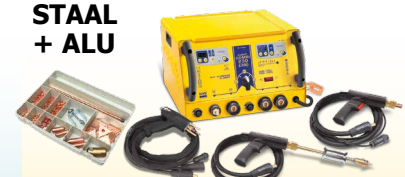
SPEEDLINER Combi 230 E PRO - réf. 036062