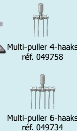
Multi-puller 4-haaks réf. 049758