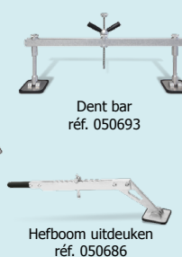
Dent bar réf. 050693