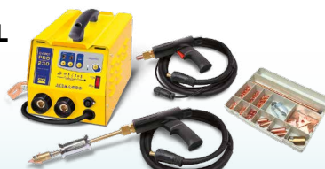
SPEEDLINER PRO 230 - réf. 036017 SPEEDLINER PRO 400 - réf. 036024