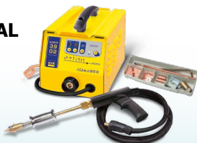
SPEEDLINER 39.02 - réf. 035010 SPEEDLINER 39.04 - réf. 035027