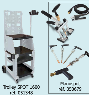
Trolley SPOT 1600 réf. 051348