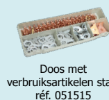
Doos met verbruiksartikelen staal réf. 051515