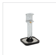
Breve piede singolo Rif. 059320