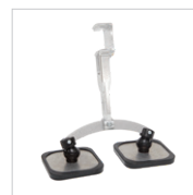
Pattino lungo doppio piede Rif. 059368 Rif : 059375 (x2)