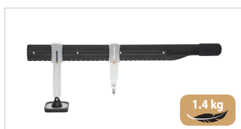
Leva di riparazione ammaccature Premium Rif. 059290