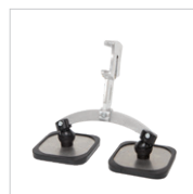
Cuscinetto corto a doppio piede Rif. 059344 Rif : 059351 (x2)