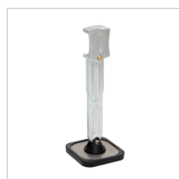
Lungo piede singolo Rif. 059337