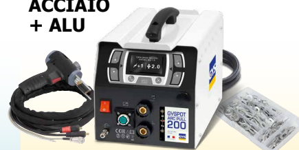
GYSPT ARCPULL 200 - ref. 057470