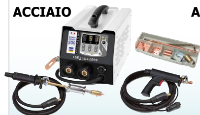
GYSPT EXPERT 200 - ref. 058842