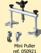
Mini Puller ref. 050921