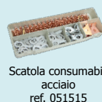
Scatola consumabili acciaio ref. 051515