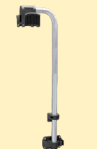
Braccio di sostegno per attrezzo di riparazione ammaccature ref. 052284