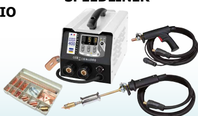
GYSPT EXPERT 400 - ref. 058859