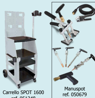
Carrello SPOT 1600 ref. 051348