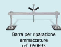
Barra per riparazione ammaccature ref. 050693